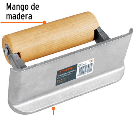
Mango de madera

Aleación de aluminio que proporciona resistencia a la corrosión