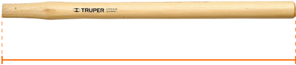
Largo 25'' (63 cm)