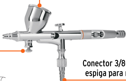
Conector 3/8-28 UN de espiga para manguera