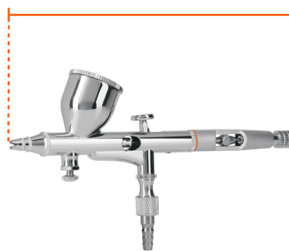
Largo 15 cm