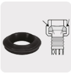
Empaque antifuga con diseño cónico