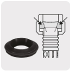
Empaque antifuga con diseño cónico