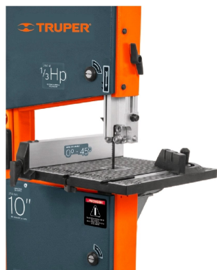
Guía de inglete