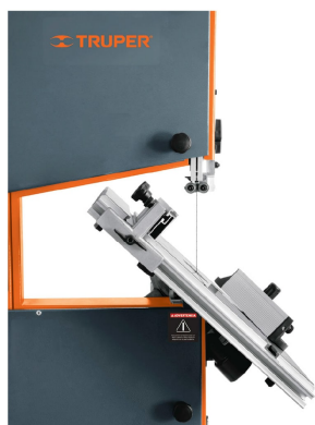
Inclinación de mesa 45°