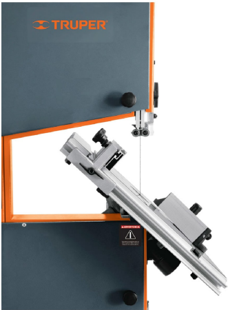
Inclinación de mesa -10° izquierda hasta 45° derecha