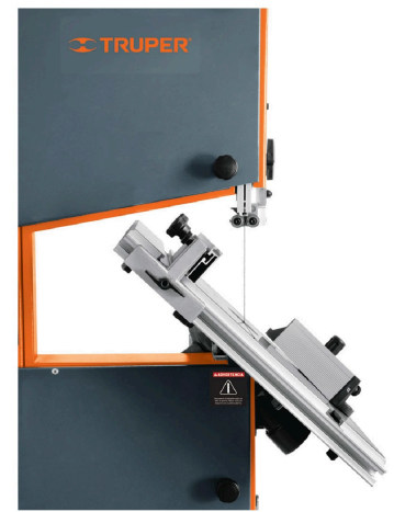
Inclinación de mesa -10° izquierda hasta 45° derecha