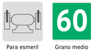
Para esmeril Grano medio