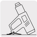
Soporte para trabajar a manos libres