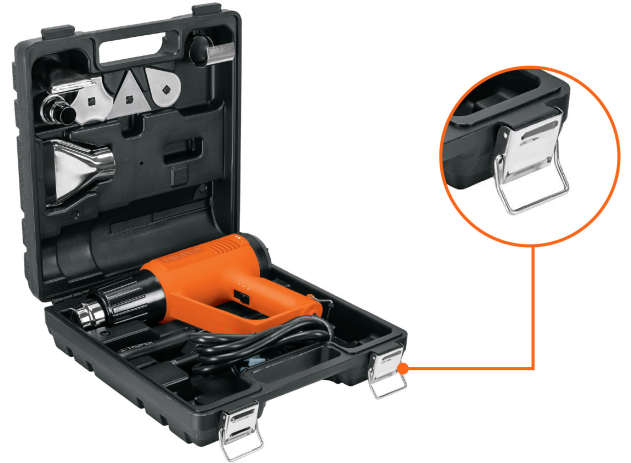
Estuche con broches metálicos