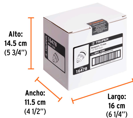
Contiene: 6 piezas