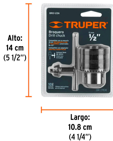
Peso: 0.33 kg (0.73 lb)