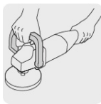
Mango abatible tipo "D"