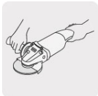
Operación a dos manos