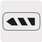
Mango de 360° tipo "D"