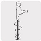
Compatible con revolvedores de pintura