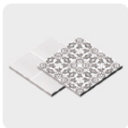
Loseta y cerámica