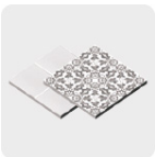
Loseta y cerámica