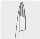
Mordazas con moleteado diagonal