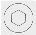
Entrada para llave allen