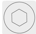
Entrada para llave allen