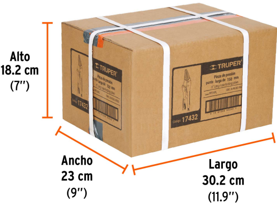
Contiene: 12 inner (36 piezas)