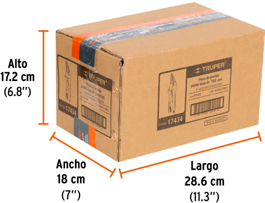
Contiene: 12 inner (36 piezas)