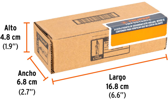
Contiene: 3 piezas