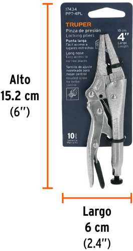
Peso: 0.11 kg (0.2 lb)