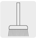
Servicios de limpieza