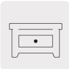
Trabajos en madera