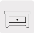
Trabajos en madera