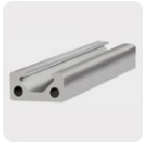
Metales no ferrosos