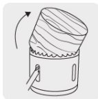
Ranura amplia para remover