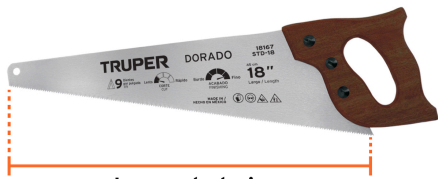
Largo de hoja 18" (45 cm)