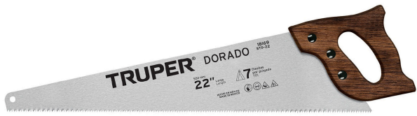
Largo de hoja 22" (55 cm)