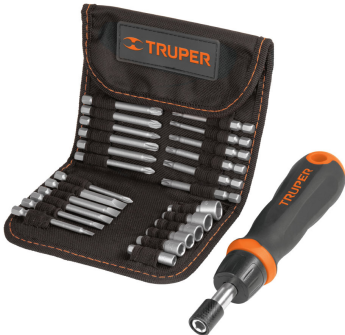
Puntas de acero al cromo vanadio