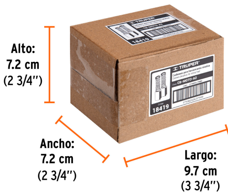
Contiene: 12 piezas