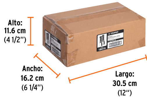
Contiene: 8 inner (96 piezas)