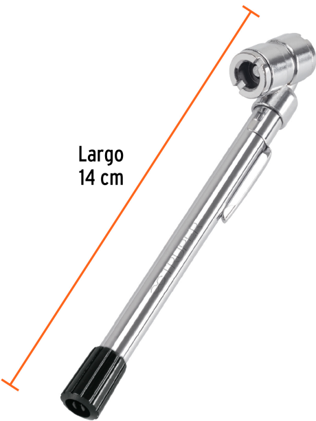
Largo 14 cm