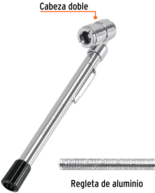
Regleta de aluminio