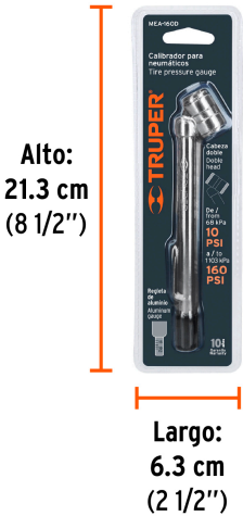
Peso: 0.07 kg (0.1 lb)