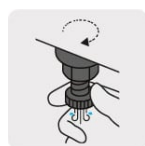
Válvula de drenado