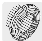
Motor con bobinas de cobre