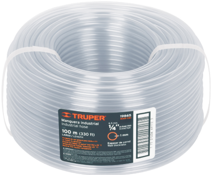
Rollo de manguera 100 m