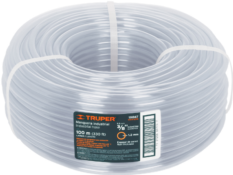
Rollo de manguera 100 m