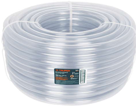
Rollo de manguera 100 m