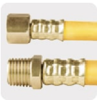
Conectores de latón