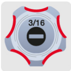
Marcado y código de color