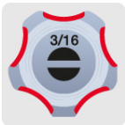
Marcado y código de color