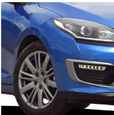
Llantas de automóviles