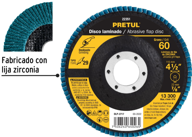
Fabricado con lija zirconia

Fabricado en China bajo las estrictas especificaciones de GRUPO TRUPER