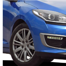
Lantas de automóviles