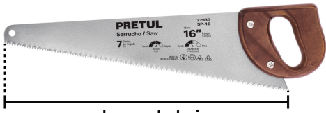
Largo de hoja 16" 40 cm)