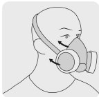
Arnés de banda elástica ajustable