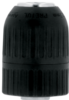
Cuerpo de nylon