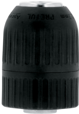
Cuerpo de nylon