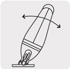
Cortes a 0°, 15°, 30° y 45° por ambos lados