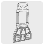
Ligero y compacto