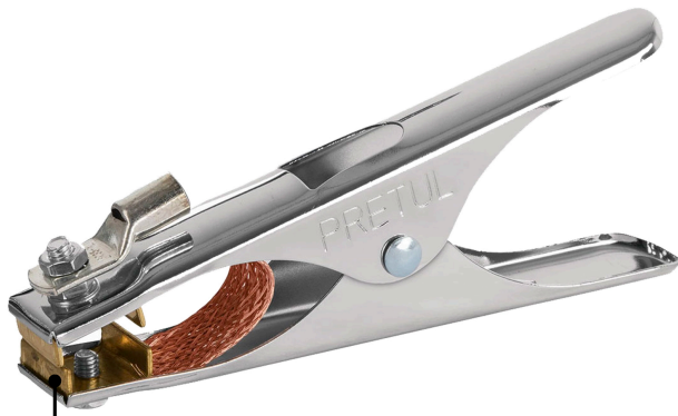
Mordaza de latón