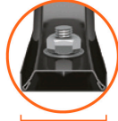
39 mm Soporte Calibre 15 (1.7 mm espesor)