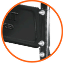
Puente Calibre 19 (1 mm espesor) Doble tornillo