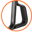
Nuevo tacón estabilizador con sujeción para descarga Calibre 15 (1.7 mm espesor)