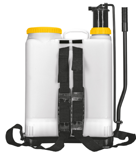
Correas ajustables para fácil transporte