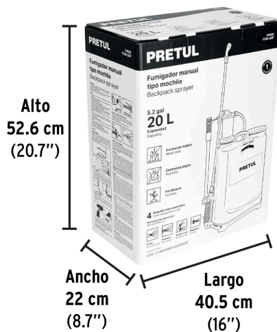
Peso: 3.92 kg (8.6 lb)