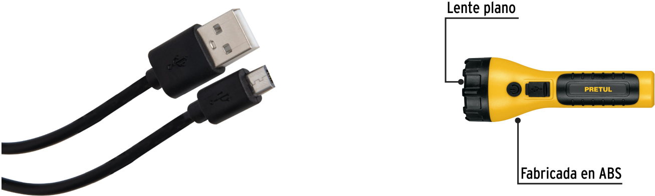
Incluye cable USB